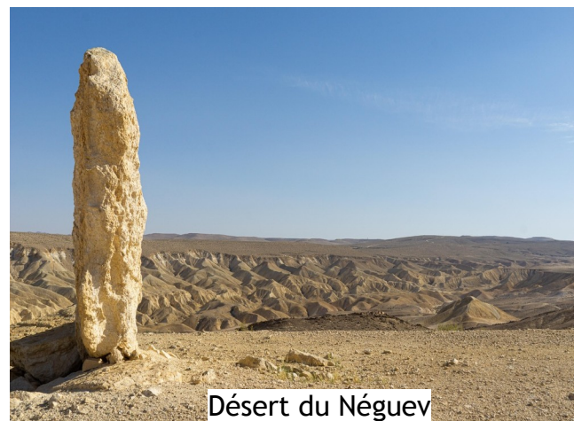
Désert du Néguev

Entrer en Carême, ce n'est pas d'abord aller au désert, mais consentir à se laisser conduire par l'Esprit, où qu'il mène, au désert comme en ville, dans la solitude ou avec des amis. Jésus ne va pas de lui-même au désert, là où la vie est impossible quand viennent la faim et la soif. Il y est conduit par l'Esprit.