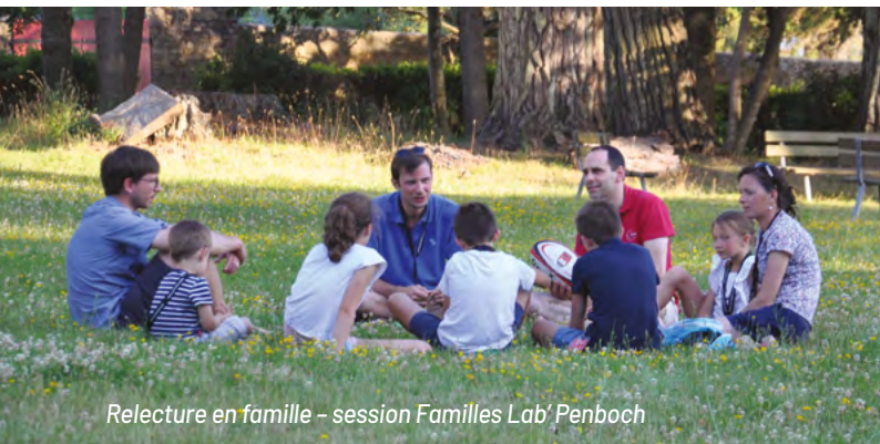
Relecture en famille – session Familles Lab' Penboch

Sûrement la vie familiale offre-t-elle bien des ressources encore pour nous conduire à nous-mêmes et, en même temps, nous ouvrir aux autres. Nous croyons que, cela s'exerce, s'apprend, se vérifie et s'éduque à l'école de l'Évangile.