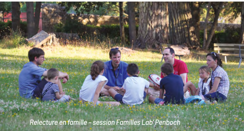
Relecture en famille – session Familles Lab' Penboch

Sûrement la vie familiale offre-t-elle bien des ressources encore pour nous conduire à nous-mêmes et, en même temps, nous ouvrir aux autres. Nous croyons que, cela s'exerce, s'apprend, se vérifie et séduque à l'école de l'Évangile.