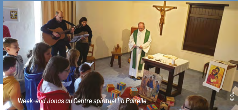
Week-end Jonas au Centre spirituel La Pairelle