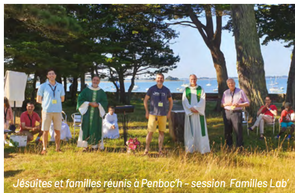
Jésuites et familles réunis à Penboc'h - session 'Families Lab'